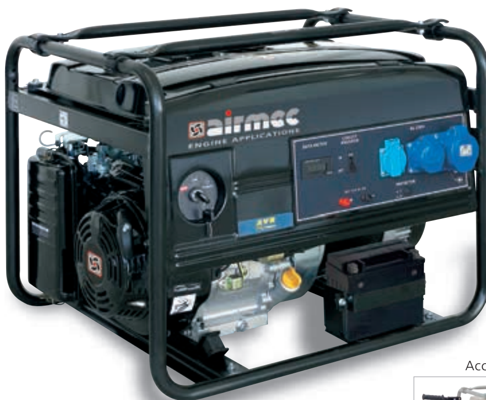
Accessorio - Accessory